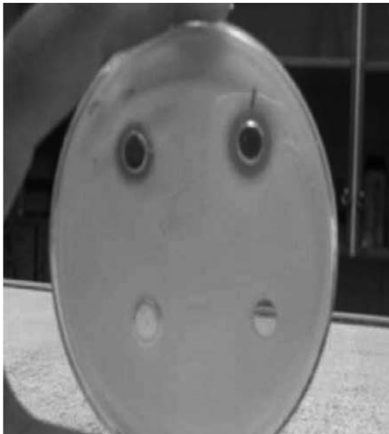
شکل ۳. اثر سوسپانسیون پروبیوتیکی و اسید های آلی با pH خنثی در مهار رشد اشریشیا کلی O157:H7 : اطراف چاهک های حاوی اسید آلی (دو چاهک پایین) در مقایسه با چاهک حاوی پروبیوتیک (دو چاهک بالا) رشد باکتری ممانعت نشده است.

کلی O157:H7 نمی تواند باشد (۱۵). به همین دلیل در این پژوهش ما نیز اثر آنتاگونیسمی اسیدهای آلی بر رشد باکتری اشریشیا کلی O157:H7 مورد بررسی قرار دادیم. نتایج نشان داد که اسیدهای آلی نمی توانند اثر قابل ملاحظه ای بر علیه این باکتری ایجاد نمایند. به نظر می رسد که عوامل دیگری مانند باکتریوسین ها، تولید و ترشح متابولیت های آلی و گلیکولپیدهایی با فعالیت بیولوژیک قوی در اثر مهار بر علیه این باکتری می تواند نقش تعیین کننده داشته باشد. اثر اسیدهای آلی و باکتریوسین ها و متابولیت های آلی تولید شده توسط پروبیوتیک ها علیه اشریشیا کلی O157:H7 روی رده سلولی ورو نیز بررسی شد و نتایج مشابهی حاصل گردید. متابولیت های آلی تولید شده حتی زمانی که pH محیط خنثی شد مانع تخریب رده سلولی ورو توسط اشریشیا کلی O157:H7 گردید (نتایج در این مقاله ذکر نشده است).